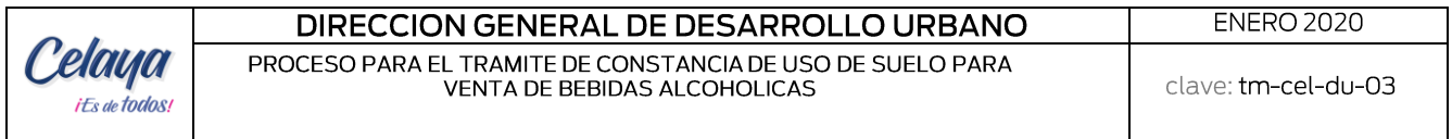
Diagrama de flujo

Proceso para la obtencion de la Constancia de Uso de Suelo para venta de bebidas alcoholicas